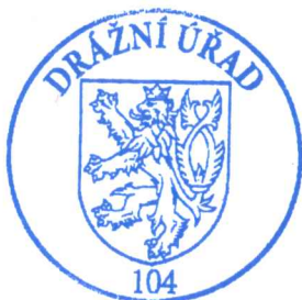
otisk úředního razítka

Proti tomuto rozhodnutí může účastník řízení podat odvolání podle §81 odst. 1. zákona č. 500/2004 Sb., správní řád, ve znění pozdějších předpisů (dále jen "správní řád"), ve lhůtě 15 dnů ode dne jeho oznámení, k Ministerstvu dopravy, podáním učiněným u Drážního úřadu, sekce infrastruktury, územní odbor Plzeň, Škroupova 11, 30136 Plzeň. Odvolání jen proti odůvodnění rozhodnutí je podle ustanovení §82 odst. 1 správního řádu nepřípustné. Odvolání se podává s potřebným počtem vyhotovení tak, aby jeden stejnopis zůstal správnímu orgánu, a aby každý účastník dostal jeden stejnopis. Nepodá-li účastník potřebný počet stejnopisů, vyhotoví je Drážní úřad na náklady účastníka.